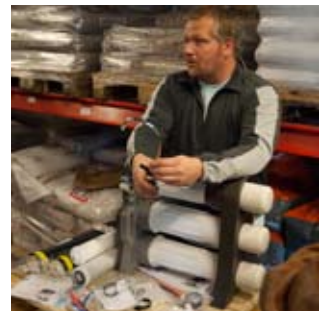
Jonas fick svara på frågor som rörde allt mellan filter och teknik.