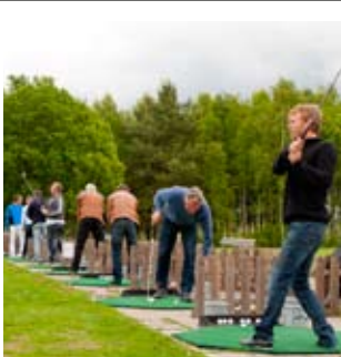
Mellbykillarna kan eventuellt gå Proffstouren nästa år?