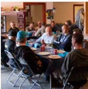
God stämning och snack vid lunchbuffén.

H2O Filtertechnik har fyllt 5 år och det firade vi tillsammans med kunder, partners och vänner. Vi är väldigt glada att så många ville komma och dela glädjen med oss! Till er som inte kunde komma har vi sammanfattat det viktigaste från dagen, och hoppas vi får tillfälle att ses lite längre fram.